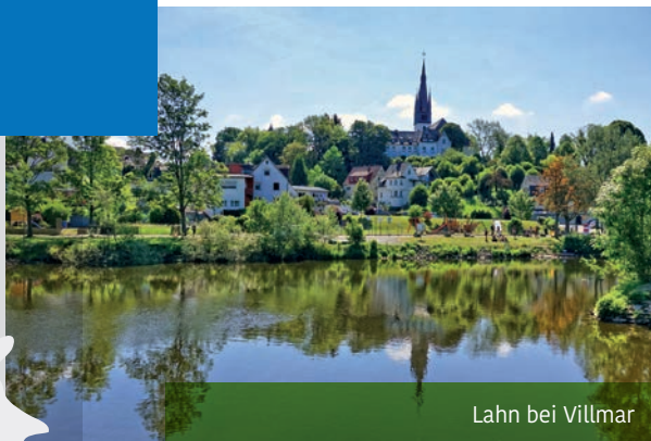
Lahn bei Villmar

Gemeindeverwaltung Marktflecken Villmar, Tourist-Info, König-Konrad-Straße 12, 65606 Villmar, Tel. 0 64 82 / 91 21 15 www.marktflecken-villmar.de