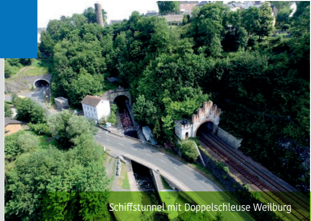
Schiffstunnel mit Doppelschleuse Weilburg