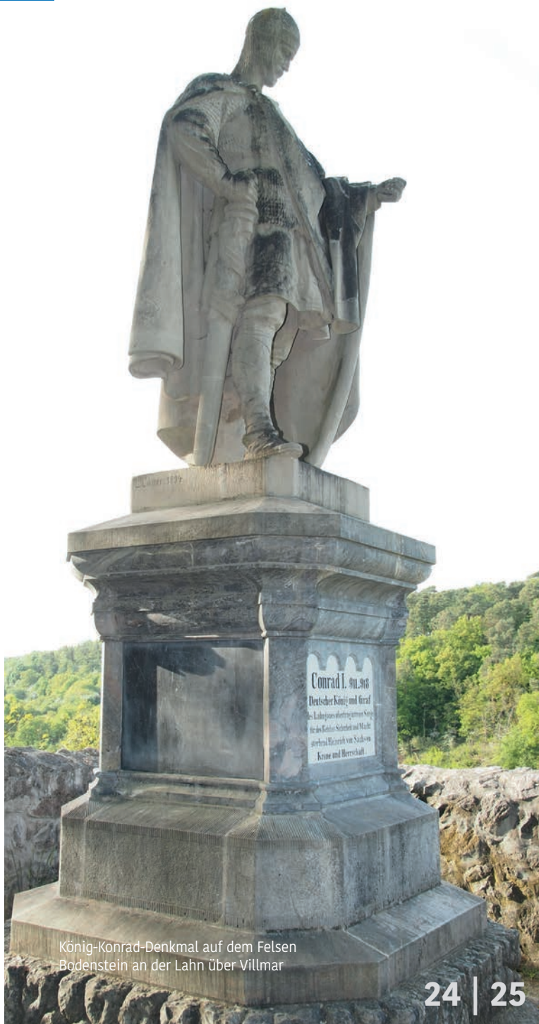
König-Konrad-Denkmal auf dem Felsen Bodenstein an der Lahn über Villmar