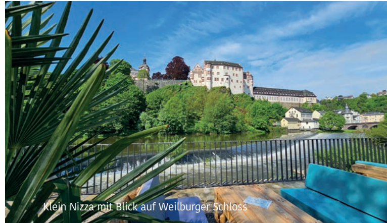
Klein Nizza mit Blick auf Weilburger Schloss

Information: Wildpark „Tiergarten Weilburg“ Tiergartenstraße , 35781 Weilburg, Tel. Kasse: 0 64 71 / 62 62 84 Tel. Gaststätte: 0 64 71 / 62 68 84 4, E-Mail: info@wildpark-weilburg.de, www.wildpark-weilburg.de